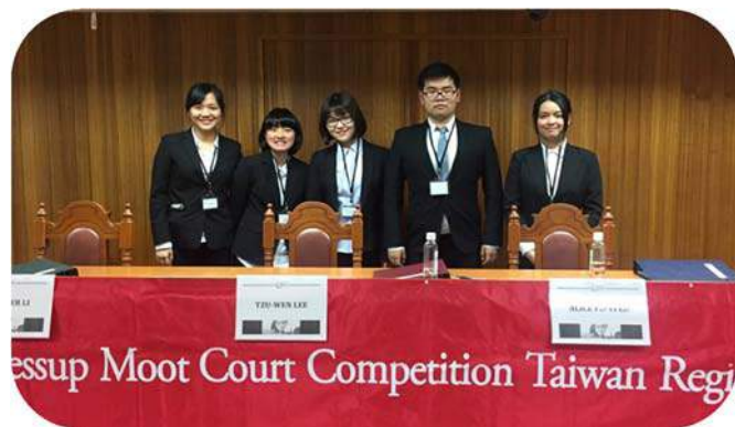
▲ 社員於傑賽普國際法模擬法庭辯論賽合影

國際法研究社成立之主要為目的有二：一是透過國際辯論賽全程使用英語撰寫書狀、論述主張及答辯，培養學生專業英語能力及拓展國際視野。其次是加強學生對國際法之整體理解與應用能力。國際法研究社於 105 學年度第 2 學期並獲得本校校內學生學習成果暨學術競賽獎勵。