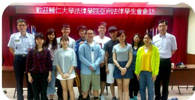
▲ 台北看守所參訪合影

除了演講外，本學期 ALSA 的參訪包括：2016 年 10 月 19 日參觀台灣高等法院、2017 年 4 月 26 日新北地檢署，瞭解法院作業流程、旁聽法官開庭、及書記官等司法人員的工作，對會員決定是否從事相關職業有相當大幫助。5 月 3 日參觀台北看守所，看到收容人的房間、刑場、活動場地等，近距離接觸到收容人的生活，也深思收容人人權議題；5 月 26 日在立法院很幸運適逢部分法案三讀程序，都是非常難得的經驗。