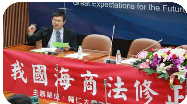
▲ 黃裕凱教授說明研修草案之調整與增進之總體面