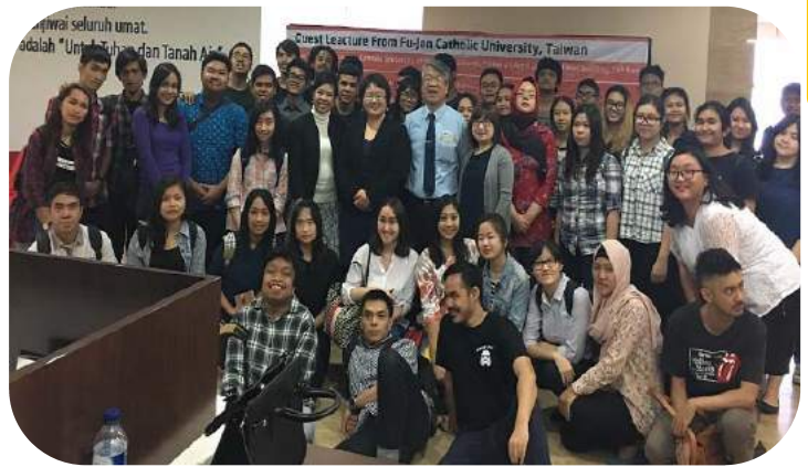
▲ 演講現場參與人數盛況空前