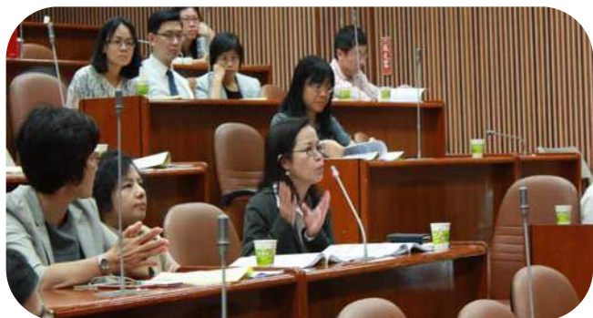
▲ 與會人士踴躍發言討論

我國 1999 年修正的海商法，面對國際航運環境及海事海商國際立法之快速變動、兩岸航貿交往頻繁，以及北歐各國、德國、日本、大陸地區海商法之研修等，已有全面檢討修正之必要。法律學界於 2012 年底召開九場研討會，於 2014 年完成學術版『海商法修正建議』485 條文。交通部(航港局)的官方研修於 2013 年底啟動，由『台灣海商法學會』承接研修，動員國內超過十位的專家學者，歷經三年多，於今年初完成 229 條文的修正草案。本院 2017 年 5 月 26 日於野聲樓谷欣廳主辦「我國海商法修正研討會系列(十) - 台灣海商法學會『海商法修正草案』之調整與增進」研討會，針對總體面、基礎法學面、航運實務面，及程序法暨司法實務面四大面向，分別提出看法與討論，期使我國的海商新法更好、更周延、更符合實務及國際規範。