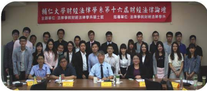
▲ 財法論壇全體人員合影

財經法律學系碩士班二年級學生於 2017 年 5 月 10 日於樹德樓 317 會議室舉辦「第十六屆財經法律論壇」。本論壇自 93 學年度至今已舉辦 16 屆，完全由研究生主導主辦研討會事務，由本系研究生擔任報告人、與談人，並邀請東吳大學法研所碩士生及博士生擔任報告人，另外邀請系上老師擔任主持人及與談人，藉由本活動達到學術交流及研討之目的。