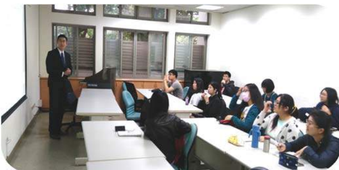
▲ 律師分享律師工作甘苦

為結合產學，105 學年本院所開法律實務實習課程中，除要求修課學生至少 5 次週六前往法律服務中心，進行法律諮詢，親自接觸民眾與真實案件。也為了提早使其瞭解律師業務及事務所經營，特邀請已執業的律師學長為學生講授律師工作及展望、與當事人面談技巧、行政書狀心得、刑事書狀心得、民事書狀心得、民事執行經驗及注意事項、智慧財產或勞工案件經驗、律師事務所之經營等 8 次演講。學長姐們大方分享私房秘技，甚至分享失敗經驗，讓學生受益很大。