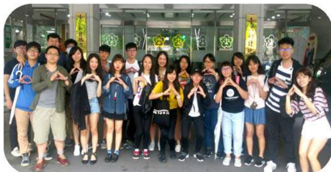
▲ 新北地檢署參訪合影