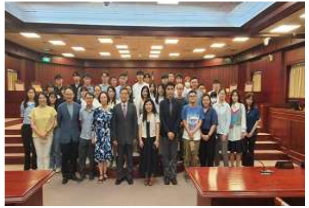
▲ 林俊益大法官及朱健文主任與楊子慧副院長帶領法律學院同學合影

2023年3月15日楊子慧主任邀請輔大法律系畢業(學士、碩士、博士),現任司法院副院長室主任的朱健文學長,以「憲法維護者門徒的奇幻之旅」為題,和在校學弟妹分享個人親炙重量級大法官的人生歷練,國際文化交流的甘苦談,讓同學們瞭解將來從事憲法審判及行政人員的職涯發展上,必須面臨的考驗與因應之道。朱學長更加碼安排5月4日師生參訪司法院活動,由林俊益大法官親自接待參觀大法官會議室及憲法法庭,聽說大法官會議室不開放參觀,這次可是有史以來獨一無二的一團喔!