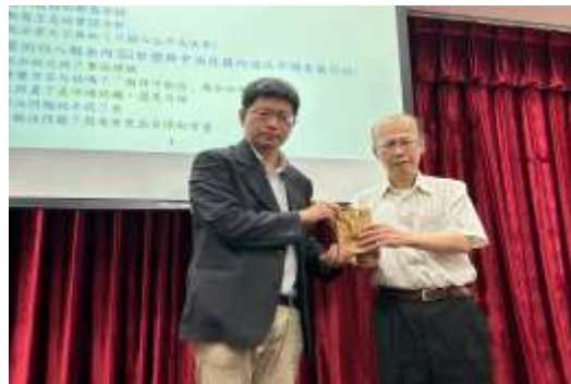
▲院長致贈帥嘉寶法官紀念禮品

2023年5月3日吳志光院長邀請最高行政法院帥嘉寶庭長(輔大法律系畢業、臺大經濟研究所碩士)專題演講「法律經濟學簡介」,精彩內容有:經濟學基本觀念的回顧、法律經濟學之重點介紹、法律經濟學思辯過程的歷史回顧、法律經濟學在司法實務工作中之實際運用經驗、法律學門的獨特價值,參與同學無不收穫滿滿。