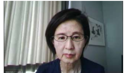
▲ 第六場專題演講 國分典子教授