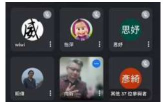
▲張向昕董事長演講合影

2022年5月6日邀請到原民立委鄭天財委員親臨本校財法系原住民專班進行演講，演講主題為：原住民權益的實踐。委員從憲法增修條文第10條第11項第12項、原住民族基本法、原住民身分法、姓名條例第1條及第4條、森林法第15條第4項、野生動物保育法21條之1、漁業法第44條、山坡地保育利用條例第37條逐一解釋，並介紹立法歷程。讓同學對於原住民族的立法政策，有較完整的了解。講述內容令在場學生們印象深刻，並多有收穫。