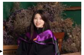
專利師考試經驗分享 ▶