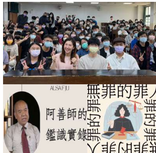
▲ 阿善師的鑑識實錄