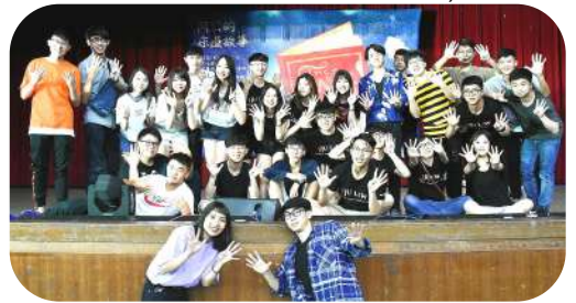
▲ 全體工作人員大合照

財法系於 2018 年 5 月 23 日在百鍊廳舉辦財法之夜 The Shape Of Law-這就是《愛》，每年固定會舉辦的財法之夜，讓平常不甚熟悉的各年級學生，能欣賞彼此帶來的表演，讓彼此的感情更加融洽。