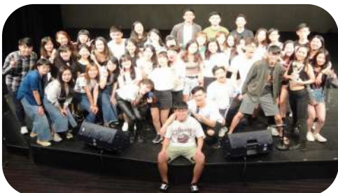
▲ 全體工作人員大合照