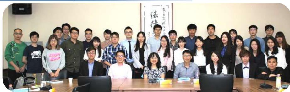
▲ 財法論壇全體人員合影

財經法律學系碩士班二年級學生於2018年5月9日假樹德樓317會議室舉辦「第十七屆財經法律論壇」，本論壇自93學年度至今已舉辦17屆，完全由研究生主辦研討會事務，由本系研究生擔任報告人、與談人，並邀請政治大學風險管理與保險學系法律組碩士生及財團法人商業發展研究院佐理研究員擔任報告人，另外邀請系上老師擔任主持人及與談人，藉由本活動達到學術交流及研討之目的。